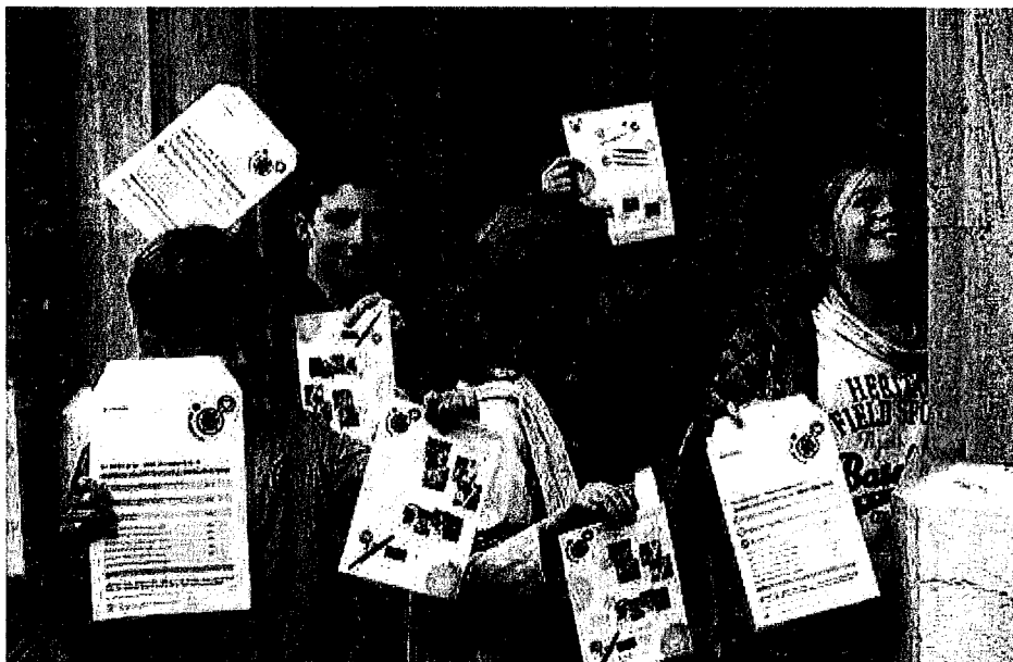
Les enfants et leurs sourires seront prochainement sur le pas de votre porte.

les fléaux comme la pauvreté ne le concernent que de façon très éloignée. Et pourtant, en 2016, ce sont plus de 4'000 familles touchées par des problèmes financiers qui ont été aidées dans la région grâce à la vente des timbres et des autres articles Pro Juventute. Le phénomène est encore plus préoccupant sur le plan national puisque 7% de la population